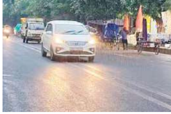
लोगों को गुलाबी ठंड महसूस होने लगी। मौसम विभाग की मानें तो दाना चक्रवात का असर धीरे-धीरे कम हो रहा है।

पटना, (एजेंसी) बिहार के कई जिलों में दाना चक्रवात का असर है। दक्षिण-पूर्वी इलाकों में तेज हवा के साथ बारिश हो रही है। भागलपुर, कटिहार, किशनगंज, पूर्णिया, अररिया और मुंगेर समेत कुछ जिलों झमाझम बारिश हुई। शुक्रवार देर शाम पटना में भी हल्की बारिश हुई। पिछले 24 घंटे में सबसे अधिक भागलपुर में 11 एमएम बारिश दर्ज की गई। वहीं कटिहार में सात एमएम बारिश रिकॉर्ड की गई। इस कारण के अधिकतम तापमान में तीन डिग्री सेल्सियस तक की कमी आई।