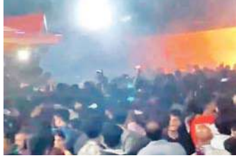
है कि वहां पर तेजी से धमाके होने लगे। इससे आसपास के लोग घायल हो गए, जिसमें बच्चे और महिलाएं भी शामिल

केरल, (एजेंसी) केरल के एक मंदिर में उत्सव के दौरान पटाखों में आग लग गई। इस हादसे में 150 से ज्यादा लोग घायल हो गए, जिनमें से आठ की स्थिति गंभीर है। यह घटना सोमवार देर रात केरल के कासरगोड के करीब स्थित नीलस्वरम स्थित वीरारकावु मंदिर के पास हुई है। घायलों को कासरगोड, कन्नूर और मंगलुरु के विभिन्न अस्पतालों में भर्ती कराया गया है। बताया जाता है कि वीरारकावु मंदिर के पास पटाखों को जमा करके रखा गया था। शक है कि इस स्टोरेज में आग लग जाने के चलते ही यह हादसा हुआ है। प्रत्यक्षदर्शियों के मुताबिक घटना उस वकत हुई जब एक मिसफायर पटाखा, स्टोर किए गए पटाखों वाली वाली बिल्डिंग पर जा गिरा। नतीजा यह हुआ