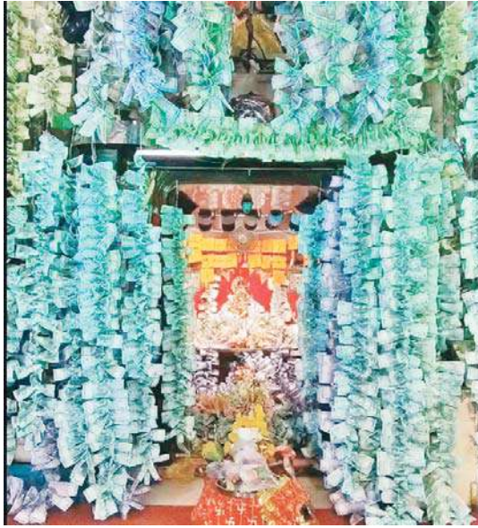
1 से लेकर 500 रुपए तक के नोटों से सजावट

रतलाम के माणक चौक स्थित इस मंदिर में नोटों और आभूषणों से सजावट की शुरुआत इस बार शरद पूर्णिमा पर 14 अक्टूबर से हुई थी। मंदिर में भक्त निशुल्क सेवा भी देते हैं। कोई नोटों की लड़िया बनाता है तो कोई नोट लेकर आने वाले श्रद्धालुओं की इंद्रि करता है। कुछ भक्त दिन से लेकर रात तक सजावट में लगे रहते हैं।