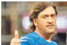
ऋतुराज गायकवाड़ को टीम की कप्तान सौंपी थी जिससे उनके भविष्य को लेकर अटकलें लगाई जाने लगी थीं।

आईपीएल के अगले सत्र से पहले खिलाड़ियों की बड़ी नीलामी होनी है। इससे पहले सभी फ्रेंचाइजी को 31 अक्टूबर तक रिटर्न किए गए खिलाड़ियों की सूची सौंपनी है। माना जा रहा है कि सीएसके इस साल धोनी को अनकेड खिलाड़ी के तौर पर रिटर्न करेगा जिससे उनके टीम से जुड़ने रहने का रास्ता साफ हो जाएगा। मालूम हो कि धोनी ने आईपीएल 2024 से पहले सीएसके की कप्तानी छोड़ दी थी और