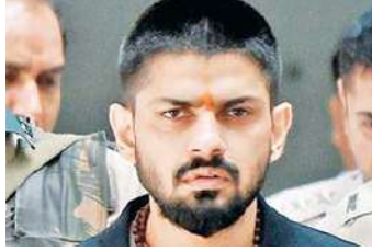
यही लगता है कि इस मामले में पुलिस अधिकारियों और अपराधी के बीच सांठगांठ है।