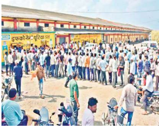
डीएपी की जगह गोमोर दी, वह भी खत्म

जो किसान लाइन में लगे हैं उन्हें कमी बताई जा रही है। दूसरी तरफ अफसर कह रहे हैं कि एकदम से खाद के लिए किसानों के आने से डिमांड के अनुसार खाद उपलब्ध नहीं हो पा रही है। रैक लगा है। जल्द किसानों को खाद उपलब्ध होगी।