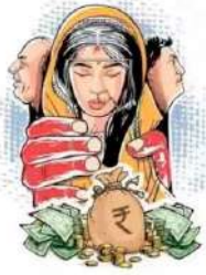
महिला थाना पुलिस के अनुसार पहला प्रकरण पीड़िता

डिटैक्टिव ग्रुप रिपोर्ट इंदौर। अलग-अलग स्थानों पर दो महिलाओं को दहेज के लिए सताने के मामलों में पुलिस ने उनके ससुराल वालों पर प्रकरण दर्ज किए हैं। एक महिला से जहां दहेज में 10 लाख रुपए की मांग की गई तो वहीं दूसरी को 2 लाख रुपए के लिए सताया गया। प्रताड़ना से तंग आकर दोनों महिलाओं ने पुलिस की शरण लेते हुए प्रकरण दर्ज कराया।