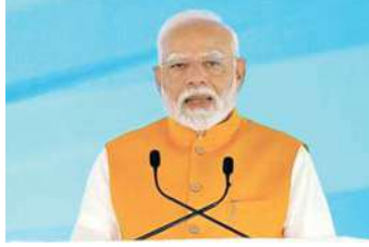
जवानों के साथ समय बिताएंगे और उन्हें दिवाली की शुभकामनाएं देंगे। उनका यह दौरा राष्ट्रीय एकता और

नई दिल्ली, (एजेंसी) प्रधानमंत्री नरेंद्र मोदी इस बार भी भारतीय सेना के सैनिकों संग दिवाली का त्योहार मना सकते हैं। सूत्रों के मुताबिक पीएम मोदी कच्छ में भारतीय सैनिकों के साथ दिवाली सेलिब्रेट कर सकते हैं। पीएम बनने के बाद यह पहली बार होगा, जब वे गुजरात में जवानों के साथ दिवाली का त्योहार मनाएंगे। इससे पहले, जब मोदी मुख्यमंत्री थे, तब भी उन्होंने गुजरात के जवानों के साथ दिवाली मनाई थी।