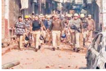
गैस के गोले छोड़े और फिर लाठीचार्ज कर दिया। कई राउंड हवाई फायरिंग भी की। करीब ढाई घंटे चली हिंसा

उधर, बार-बार समझाने के बाद भी भीड़ के शांत न होने पर पुलिस ने जवाबी कार्रवाई करते हुए पहले आंसू