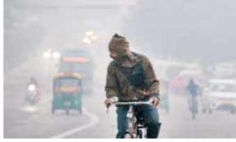
बीच, भारत मौसम विज्ञान विभाग (IMD) ने बताया कि न्यूनतम तापमान 14 डिग्री सेल्सियस दर्ज किया गया, जो इस मौसम के सामान्य तापमान से 2.7 डिग्री अधिक है।

नई दिल्ली, (एजेंसी) मौसम तेजी से करवट ले रहा है। उत्तर भारत समेत देश के कई हिस्सों में ठंड बढ़ती जा रही है। राष्ट्रीय राजधानी नई दिल्ली का भी कुछ ऐसा ही हाल है। मंगलवार सुबह दिल्ली में धुंध की एक परत छाई रही। सीपीसीबी के अनुसार कई इलाकों में वायु गुणवत्ता सूचकांक 'बहुत खराब' श्रेणी में बना हुआ है। दिल्ली की वायु गुणवत्ता में सोमवार को कुछ सुधार देखा गया था और यह 'खराब' श्रेणी में दर्ज की गई। केंद्रीय प्रदूषण नियंत्रण बोर्ड के ताजा आंकड़ों में यह जानकारी दी गई। इसके अनुसार, सोमवार को राष्ट्रीय राजधानी में वायु गुणवत्ता सूचकांक (AQI) 281 दर्ज किया गया, जबकि रविवार को शाम चार बजे यह 318 था। इस