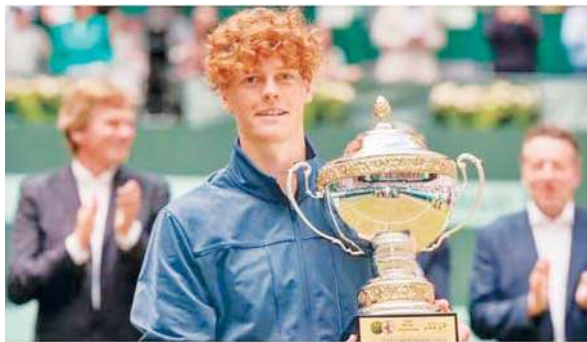
खिताब जीतने के बाद इटली दो बार चैंपियन बनने वाली पहली टीम है।

मलागा (स्पेन)। शानदार फॉर्म में चल रहे विश्व नंबर एक यानिक सिनर की बढौलत इटली ने नीदरलैंड को 2-0 से हराकर लगातार दूसरी बार डेविस कप जीत लिया। इटली लगभग 25 वर्ष तक डेविस कप खिताब से दूर रहा, लेकिन सिनर के आते ही उसे लगातार दूसरी बार चैंपियन बनने का गौरव हासिल हुआ है। सिनर ने टैलन ग्रीकस्पोर को सीधे सेटों में 7-6 (2), 6-2 से हराकर इटली को विजेता बनाया।