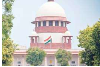
इस मामले पर सुनवाई की। उन्होंने अपने फैसले में कहा, 'इस मामले में प्रस्तुत साक्ष्य से यह स्पष्ट होता है कि

नई दिल्ली, (एजेंसी) यदि कोई व्यक्ति केवल आरक्षण लाभ प्राप्त करने के लिए बिना किसी आस्था के धर्म परिवर्तन करता है तो यह आरक्षण की नीति की सामाजिक भावना के खिलाफ होगा। यह निर्णय मंगलवार को सुप्रीम कोर्ट ने दिया है। कोर्ट ने मद्रास हाई कोर्ट के आदेश को बरकरार रखते हुए एक महिला को अनुसूचित जाति (SC) प्रमाण पत्र देने से इनकार कर दिया। महिला ने यह प्रमाण पत्र एक उच्च श्रेणी के लिपिक पद की नौकरी पाने के लिए पुदुचेरी में प्राप्त करने के उद्देश्य से मांगा था। उसने दावा किया था कि वह हिंदू धर्म अपनाकर अनुसूचित जाति में शामिल हो चुकी है।