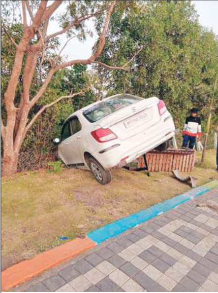
डिटैक्टिव ग्रुप रिपोर्ट

इंदौर। आज सुबह 6.30 पर एरोड्रम थाने के सामने टर्न लेती हुई कार 100 की स्पीड में फुटपाथ पर चढ़ती हुई बगीचे में घुस गई। गनीमत है उस समय कुर्सी पर कोई बैठा नहीं था। कोई जान माल की हानि नहीं हुई।