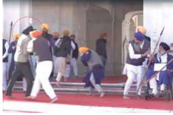
की गई है. कहा जा रहा है कि वह 1984 में पाकिस्तान गया था और पाकिस्तान से पंजाब में हथियारों और

सूत्रों के मुताबिक, हमलावर की पहचान बब्बर खालसा इंटरनेशनल (BKI) के पूर्व सदस्य के तौर पर