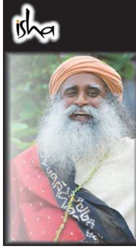
- जगगी वासुदेव

बुद्धिमान लोग चीजों को लेकर आश्चर्य करते हैं जबकि मूर्ख लोग पूरी तरह से आश्चस्त होते हैं।