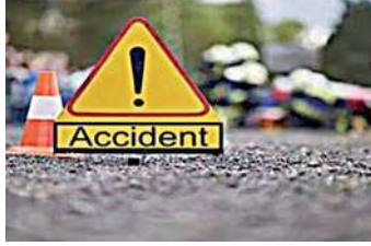
मुरादाबाद में आयोजित शादी समारोह में शामिल होकर वापस लौटते थे। भारत पेट्रोल पंप पर उतरने के बाद वह

गाजियाबाद। गाजियाबाद में क्रॉसिंग रिपब्लिक थाना क्षेत्र में NH-9 को पैदल पार करते समय अज्ञात वाहन ने चार लोगों को रौंदा डाला। हादसे में दो महिलाओं समेत तीन लोगों की मौत हो गई, जबकि एक महिला की हालत गंभीर बनी हुई है। घायल महिला का दिल्ली के अस्पताल में इलाज चल रहा है। हादसे का शिकार हुए लोग मंगलवार देर रात एक शादी समारोह में शामिल होकर वापस लौटते वक़्त पैदल NH-9 पार कर रहे थे। अधिकारियों के मुताबिक, मंगलवार रात क्रॉसिंग रिपब्लिक के थाना क्षेत्र में भारत पेट्रोल पंप के सामने सड़क हादसे की सूचना मिली थी। पुलिस ने मौके पर पहुंचकर जांच पड़ताल की तो पता चला कि चार लोग