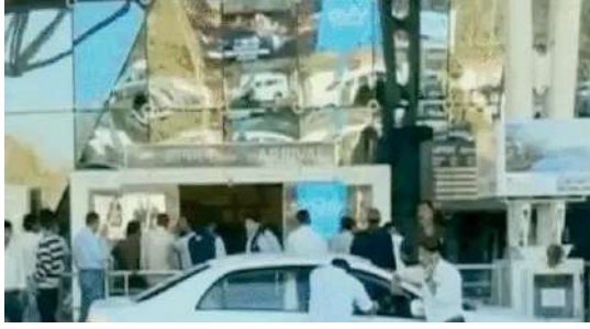
गई थी। इंदौर एयरपोर्ट प्रबंधन द्वारा जारी किए गए टेंडर 9 जनवरी को खोले जाएंगे। अधिकारियों ने बताया कि पहले जहाँ

एक दुकान इंदौर आने वाले यात्रियों के लिए अराइवल एरिया में होगी, वहीं दूसरी दुकान इंदौर से जाने वाले यात्रियों के लिए डिपार्चर के सिक्वोरिटी होल्ड एरिया में खोली जाएगी। दोनों ही दुकानों के लिए एयरपोर्ट प्रबंधन ने टेंडर जारी कर दिए हैं। बता दें कि पहले भी यहाँ एक दुकान खोली गई थी, जो की अनियमितताओं के कारण बंद हो