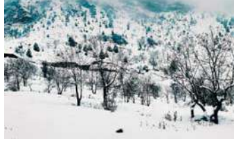
अगले 4-5 दिनों में पश्चिमी हिमालयी क्षेत्र में हल्की से मध्यम बर्फबारी हो सकती है। 4 और 5 जनवरी को

नई दिल्ली, (एजेंसी) भारत मौसम विज्ञान विभाग (IMD) ने इस सप्ताहांत जम्मू और कश्मीर में भारी बर्फबारी की भविष्यवाणी की है। शनिवार और रविवार को इसके सबसे अधिक असर देखने को मिल सकती है। इसके अलावा देश के मैदानी इलाकों में आज हल्की से मध्यम बारिश हो सकती है। शनिवार रात से लेकर सोमवार सुबह तक बर्फबारी का पीक समय रहने की संभावना जताई जा रही है। यह मौसम पश्चिमी हिमालय क्षेत्र में सक्रिय पश्चिमी विक्षोभ के कारण है।