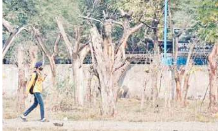
लाखों रुपए बर्बाद किए

इंदौर। इंदौर में हरियाली बचाने और बढ़ाने के लाख दावे किए जा रहे हैं लेकिन हकीकत कुछ और ही है। पिछले कुछ साल में नगर निगम ने इंदौर में हरियाली को बचाने के लिए सैकड़ों पेड़ों का ट्रांसप्लांट किया लेकिन इनमें से अधिकांश पेड़ नगर निगम की लापरवाही से ही सूख गए। इन ट्रांसप्लांट में न सिर्फ लाखों रुपए खर्च हुए बल्कि शहर की जगह भी सही उपयोग से वंचित रही और हरियाली भी न बच पाई।