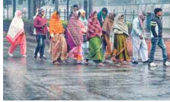
बर्फबारी हुई, जिससे पारा 4 से 7 डिग्री सेल्सियस तक गिर गया। इसी तरह पंजाब और हरियाणा में भी ठिठुरन

नई दिल्ली, (एजेंसी) राष्ट्रीय राजधानी नई दिल्ली समेत देश के अलग-अलग हिस्सों में बारिश से ठंड का प्रकोप और ज्यादा बढ़ गया है। साथ ही, सर्द हवाओं ने लोगों की कंपकंपी छुड़ा दी है। मौसम विभाग ने मंगलवार को दिल्ली का आसमान साफ रहने का अनुमान जताया है। सुबह के समय उत्तर-पश्चिम दिशा से 6 किलोमीटर प्रति घंटे से कम गति से हवाएं चलीं। विभाग ने बताया कि अधिकतर स्थानों पर धुंध और मध्यम कोहरा छाए रहने की संभावना है। सुबह के समय कुछ जगहों पर घना कोहरा देखा गया। वहीं, हिमाचल प्रदेश के जनजातीय क्षेत्रों और ऊंची पहाड़ियों में कुछ स्थानों पर बारिश और