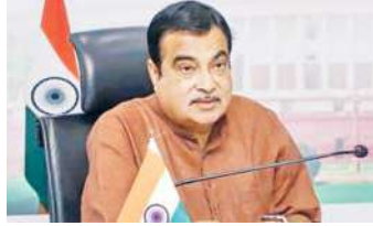
मंगलवार को केंद्रीय सड़क परिवहन और राजमार्ग मंत्री नितिन गडकरी ने भारत मंडप में सभी राज्यों और

नई दिल्ली, (एजेंसी) अब सड़क हादसों के पीड़ितों को केंद्र सरकार बड़ी राहत देने जा रही है। सड़क हादसों में घायल होने वालों को कैशलेस उपचार मिल सकेगा। केंद्रीय मंत्री नितिन गडकरी ने कैशलेस उपचार योजना का एलान किया। इसके तहत हादसों के पीड़ितों के सात दिन के इलाज का 1.5 लाख रुपये का खर्च सरकार वहन करेगी। केंद्रीय मंत्री ने कहा कि अगर पुलिस को हादसे के 24 घंटे के अंदर सूचना दी जाती है तो सरकार इलाज का खर्च उठाएगी। इसके साथ ही उन्होंने हिट एंड रन के मामलों में भी पीड़ित परिवारों को दो लाख रुपये तक मुआवजा देने की घोषणा की।