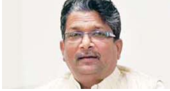
कोल्डस्टोरेज और महुआ के मिर्जानगर गांव में भी ईडी की टीम पहुंची है। जहां छापेमारी चल रही है। शुक्रवार की सुबह प्रवर्तन निदेशालय (ईडी) की टीम