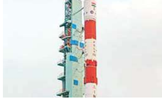
लाने में सफलता हासिल की थी। इसरो ने कहा था, "15 मीटर और फिर 3 मीटर तक की दूरी को सफलतापूर्वक

इससे पहले इसरो ने दो बार डॉकिंग का प्रयास किया था, लेकिन तकनीकी समस्याओं के कारण 7 और 9 जनवरी को यह संभव नहीं हो सका। 12 जनवरी को इसरो ने सैटेलाइट को 15 मीटर और 3 मीटर की दूरी तक