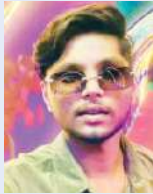
उसके गले की हड्डी टूट गई और सिर में भी चोट आई। उसके गिरते ही साथी दोस्तों ने उसके स्वजनों को सूचना दी और