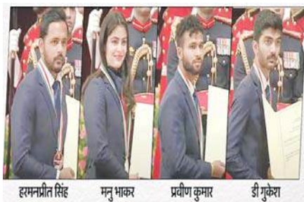
हरमनप्रीत सिंह, मनु भाकर, प्रवीण कुमार, डी गुकेश

नई दिल्ली। पेरिस ओलंपिक में दो ओलंपिक पदक जीतने वाली भारत की महिला निशानेबाज मनु भाकर और विश्व शतरंज चैंपियनशिप के विजेता भारतीय ग्रैंडमास्टर डी गुकेश सहित चार खिलाड़ियों को खेल रत्न पुरस्कार से सम्मानित किया गया। राष्ट्रपति द्रौपदी मुर्मू ने शुरुवार को राष्ट्रपति भवन में खेल पुरस्कार विजेताओं को सम्मानित किया। इस दौरान खेल मंत्री मनसुख मांडविया और अन्य केंद्रीय मंत्री भी मौजूद रहे।