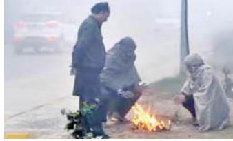
उम्मीद है। दिल्ली में कल का न्यूनतम तापमान 13.53 सेल्सियस दर्ज किया गया, जबकि अधिकतम तापमान

नई दिल्ली, (एजेंसी) उत्तर भारत के कई हिस्सों में ठंड का प्रकोप जारी है। दिल्ली-एनसीआर समेत अलग-अलग इलाकों में तापमान में गिरावट दर्ज की गई। हिमाचल प्रदेश के कुछ हिस्सों में शीतलहर की स्थिति बनी हुई है और अधिकतर राज्यों में सुबह घना कोहरा छाया हुआ है। बारिश ने ठंड के दिनों में लोगों की मुश्किलें और बढ़ा दी है। राजधानी दिल्ली में आज न्यूनतम तापमान 10.05 डिग्री सेल्सियस दर्ज किया गया। मौसम विज्ञान विभाग के मुताबिक, शनिवार को बादल छाए रहने की संभावना है। कुछ जगहों पर बूंदबांदा भी हो सकती है। अधिकतम तापमान 16.99 सेल्सियस रहने की