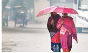
हल्की से मध्यम बारिश या बर्फबारी होने की संभावना है, जबकि उसके बाद 27 जनवरी तक मौसम शुष्क रहेगा।

नई दिल्ली, (एजेंसी) दिल्ली-एनसीआर सहित देश के कई इलाकों में कड़ाके की ठंड फिर दस्तक देने वाली है। मौसम विभाग के ताजा अनुमान के मुताबिक, 23 जनवरी तक पश्चिमी हिमालयी क्षेत्र में अलग-अलग जगहों पर बारिश और बर्फबारी की संभावना है। मौसम विभाग का कहना है कि 22 जनवरी को राजस्थान और पश्चिमी मध्य प्रदेश में बारिश हो सकती है। आईएमडी के पूर्वानुमान के मुताबिक, 22 जनवरी को हिमाचल प्रदेश, उत्तराखंड, हरियाणा, चंडीगढ़, पश्चिमी उत्तर प्रदेश में गरज के साथ बारिश की संभावना है।