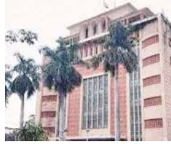
कराई। इसको मिलाकर बजट चार लाख करोड़ रुपये तक का हो सकता है।

गरीब और किसान वर्गों के लोगों को केंद्रीय योजनाओं का लाभ शत प्रतिशत उपलब्ध कराने के निर्देश दे चुके हैं। इसी क्रम में वित्तीय वर्ष 2025-26 के लिए बजट तैयारी के संबंध में 'बजट पर संवाद' 23 जनवरी को आर.सी.व्ही. पी नरोन्हा प्रशासन एवं प्रबंधकीय अकादमी भोपाल में सुबह 10:30 बजे से होगा। बजट पर संवाद में उप मुख्यमंत्री एवं वित्त मंत्री जगदीश देवड़ा विभिन्न क्षेत्रों के विषय विशेषज्ञों के साथ चर्चा कर आगामी बजट को अधिकाधिक जनोपयोगी और प्रभावशाली बनाए जाने के लिए बहुमूल्य सुझाव प्राप्त करेंगे। बता दें, इस बार का बजट 3 लाख 65 हजार करोड़ रुपये से अधिक का हो सकता है। हाल ही सरकार की 22 हजार करोड़ रुपए की राशि अलग-अलग विभागों को अनुपूर्क बजट के माध्यम से उपलब्ध