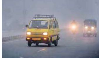
अनुसार आज बारिश के भी आसार हैं। यूपी के ज्यादातर हिस्सों में पिछले दो दिनों से धूप

लखनऊ, (एजेंसी) यूपी की राजधानी लखनऊ सहित अवध क्षेत्र में मौसम ने गुरुवार को अचानक यू-टर्न लिया। दो दिन धूप खिलने से पाया उछला, जो गुरुवार सुबह घने कोहरे और ठंड के साथ एक्कम से बढ़ गया। इससे गलन और ठिठुरन बढ़ गई। बाह्य गंतव्य स्थान तक पहुंचने के लिए लाइट जलाकर रेंगे हुए दिखे। वहीं स्कूली बच्चों और आफिस जाने वाले लोगों को भी खासी दिक्कतों का सामना करना पड़ा। लोग अलाव के पास बैठकर ठंड से बचाव करते नजर आए। सड़कों पर एक तरह से सत्राटा छाया रहा। अति आवश्यक होने पर ही लोग घरों से बाहर निकले। मौसम विभाग के