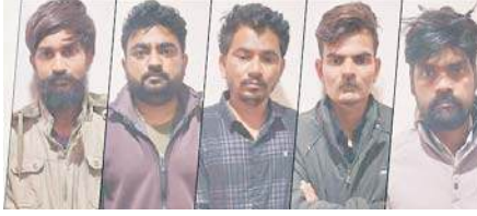
एक अधिकारी ने शुक्रवार को बताया कि आरोपियों ने खंभात शहर के पास एक फैक्टरी किराए पर ली थी।