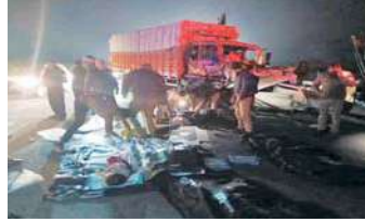
भेजा है। ये हादसा आगरा-लखनऊ एक्सप्रेसवे के 31 किमी

आगरा, (एजेंसी) आगरा के फतेहाबाद में लखनऊ एक्सप्रेस-वे पर सोमवार सुबह भीषण हादसा हो गया। कुंभ स्नान कर कार से जा रहे परिवार की कार हादसे का शिकार हो गई। बताया गया है कि कार अनियंत्रित होकर डिवाइडर से टकराई। इसके बाद कार दूसरी लाइन में चली गई और सामने से आ रहे ट्रक से भिड़ गई। टक्कर इतनी भीषण थी कि कार सवार पूरे परिवार की मौके पर ही मौत हो गई। हादसे की सूचना मिलते ही पुलिस मौके पर पहुंच गई। पुलिस ने कार में फंसी पति-पत्नी के साथ मासूम बेटे और बेटी की लाश को बाहर निकाला। पुलिस ने शिनाख्त के बाद शवों को पोस्टमार्टम के लिए