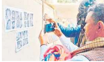
शुरू हो गई है। आज न्यायिक आयोग के सदस्य आज मौके पर पहुंच कर मौके का जायजा लेंगे।

प्रयागराज, (एजेंसी) प्रयागराज महाकुंभ में मौनी अमावस्या पर भगदड़ हुई। इसके बाद भगदड़ को लेकर प्रेस कॉन्फ्रेंस में अधिकारियों ने बताया कि महाकुंभ भगदड़ हादसे में 30 श्रद्धालुओं की मौत हो गई और 60 घायलों को अस्पताल पहुंचाया गया। मरने वालों में 25 की पहचान कर ली गई है और पांच अज्ञात है। अब 2 दिन बाद प्रशासन की ओर से 24 अज्ञात मृतकों के चेहरे के पोस्टर लगा दिए गए हैं। इन पोस्टर से परिजन मृतकों की पहचान की कोशिश कर रहे हैं। पोस्टमार्टमहाउस के बाहर लगे इस पोस्टरों से अब कई तरह के सवाल खड़े होने लगे हैं। उधर, भगदड़ में मामले की न्यायिक जांच