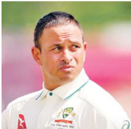
और एक छक्का लगाया। इसी के साथ वह 38 से ज्यादा की उम्र में दोहरा शतक लगाने वाले दूसरे ऑस्ट्रेलियाई बल्लेबाज बन

श्रीलंका के खिलाफ जारी गाल टेस्ट के दूसरे दिन बाएं हाथ के बल्लेबाज ने दोहरा शतक जड़ा। उन्होंने 352 गेंदों का सामना किया और 232 रन बनाए। इस पारी के दौरान अनुभवी बल्लेबाज ने 16 चौके