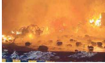
किसी के हाताहत होने की खबर नहीं है। आग और धमाकों से आसपास भय और अफरा तफरी का माहौल रहा और

गाजियाबाद। दिल्ली से सटे गाजियाबाद जिले के टीला मोड़ थाना क्षेत्र में शनिवार तड़के दिल्ली-वजीराबाद रोड पर भोपुरा चौक पर एलपीजी गैस सिलेंडर ले जा रहे ट्रक में भीषण आग लग गई। इससे एक के बाद एक कई जोरदार धमाके हुए। सिलेंडर फटने से दो मकानों और तीन गाड़ियों में भी आग लग गई। इस हादसे के बाद पूरे इलाके में हड़कंप मच गया। घटना की जानकारी मिलते ही मौके पर पहुंची गाजियाबाद पुलिस और दमकल की टीम ने तुरंत आसपास के घरों को खाली कराया। करीब 2 घंटे की कड़ी मशक्कत के बाद आग पर पूरी तरह से काबू पा लिया गया है। इस भीषण अग्निकांड में अभी तक