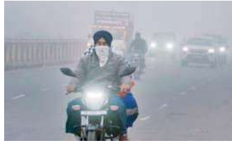
है। दिल्ली में रविवार को न्यूनतम तापमान 11.3 डिग्री सेल्सियस दर्ज किया गया, जो इस मौसम के औसत

नई दिल्ली, (एजेंसी) ठंड एक बार फिर से वापसी करती नजर आ रही है। घने कोहरे और सर्द हवाओं का दौर लौट आया है। दिल्ली-एनसीआर में सोमवार सुबह घना कोहरा देखा गया जिससे यातायात में परेशानियां हो रही हैं। साथ ही, ठंडी बढ़ने से लोगों की कंपकंपी भी छूटने लगी है। भारत मौसम विज्ञान विभाग (IMD) ने दिल्ली में सोमवार को घने कोहरे के साथ ही बदल जाए रहने का अनुमान जताया है। कुछ इलाकों में हल्की बूंदबांदी भी हो सकती है। मौसम विभाग ने बताया कि राजधानी में सोमवार को अधिकतम और न्यूनतम तापमान क्रमशः 22 और 9 डिग्री सेल्सियस रहने का अनुमान