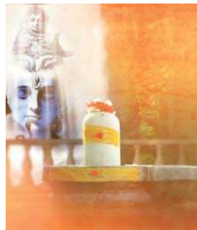
देखने लायक है।

हिमाचल प्रदेश के मंडी में भूतनाथ का मंदिर देश में सबसे बड़े शिवरात्रि उत्सव की मेजबानी करता है। कहते हैं कि मंडी के शाही परिवार ने लगभग 500 साल पहले इस परंपरा की शुरुआत की थी और अब हर साल एक हफ्ते तक चलने वाला अंतर्राष्ट्रीय मंडी शिवरात्रि मेला यहां आयोजित किया जाता है। ऐसे में ये मेला