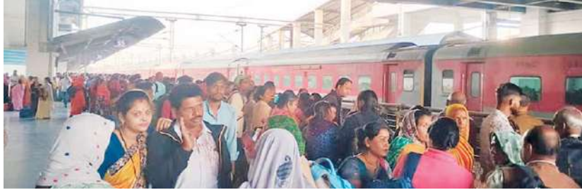
दिनों की तरह आज भी लोग प्रयागराज की जानकारी के लिए बताते कि भोपाल स्पेशल ट्रेन चल रही है। इसे देखते हुए भोपाल मंडल के हर स्टेशन के फोटो, मंडल से रोजाना 50 से ज्यादा कुंभ

डिटिविट्व ग्रुप रिपोर्ट भोपाल, एजेंसी। दिल्ली रेलवे स्टेशन में हुई भगदड़ के बाद राजधानी भोपाल के स्टेशनों पर अलर्ट जारी किया गया है। रविवार को छुट्टी के दिन भी अधिकारियों ने सभी स्टेशनों का जायजा लिया। RPF-GRP सहित रेलवे स्टाफ पूरे समय डटे रहे। वहीं प्रयागराज जाने वालों की भीड़ में कोई कमी नहीं आई है।