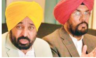
विभाग के नाम पर फैसले लेते रहे? गवर्नर द्वारा जारी नए आदेश में बताया गया कि