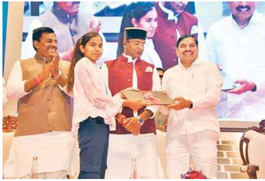
लैपटॉप खरीदने की रसीद अपनी शाला में आवश्यक रूप से जमा कराएं।

◆ डिटैलिव ग्रुप रिपोर्ट भोपाल, एजेंसी। मुख्यमंत्री डॉ. मोहन यादव ने कहा है कि परिवार परंपरा में मां द्वारा अपने बच्चों को पुष्पित, पोषित करने में प्राप्त आनंद का शब्दों में वर्णन नहीं किया जा सकता। इसी प्रकार प्रदेश के प्रतिभावान विद्यार्थियों को लैपटॉप प्रदान करने से जो आनंद प्राप्त हो रहा है, वह वर्णनातीत है, यह जीवन भर याद रहने वाली अनुभूति है। जैसे परिवार में सदस्यों का सभी संसाधनों पर अधिकार होता है, उसी प्रकार राज्य सरकार के सभी संसाधनों पर समाज के कमजोर से कमजोर तबके का अधिकार है। मेधावी विद्यार्थियों को लैपटॉप प्रदान करने से उनकी प्रतिभा निखरेगी, जिससे प्रदेश के उज्ज्वल भविष्य की संभावनाएं अधिक सशक्त होंगी। मुख्यमंत्री डॉ. यादव प्रदेश के 89 हजार 710 मेधावी विद्यार्थियों को लैपटॉप लेने के लिए 224 करोड़ की राशि अंतरित करने के लिए प्रशासन अकादमी में आयोजित राज्य स्तरीय कार्यक्रम को संबोधित कर रहे थे। उन्होंने सिंगल क्लिक से विद्यार्थियों के खातों में राशि अंतरित की। मुख्यमंत्री डॉ. यादव ने विद्यार्थियों से कहा कि उन्हें उपलब्ध कराई जा रही 25-25 हजार रूपए राशि का उपयोग लैपटॉप क्रय में ही किया जाए। विद्यार्थी अपनी पसंद के अनुसार, अपनी इच्छानुसार स्थान से लैपटॉप लें और