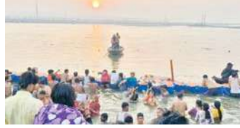
क्षेत्र में हाई अलर्ट रखा गया है। सुरक्षा और भीड़ प्रबंधन की वही व्यवस्थाएँ लागू की गई हैं जो इससे पहले हुए वसंत पंचमी और माघी पूर्णिमा के स्नान के दिन थीं।

प्रयागराज, (एजेंसी) महाशिवरात्रि पर आज महाकुंभ 2025 का छठवां और आखिरी स्नान हो रहा है। इस मौके पर बड़ी संख्या में श्रद्धालु पावन संगम स्नान के लिए महाकुंभ में पहुंच रहे हैं। पूरे मेला क्षेत्र में हाई अलर्ट है। ड्रोन और एआई कैमरों से भी त्रिवेणी संगम की निगरानी की जा रही है। मेला क्षेत्र में वाहनों का प्रवेश बंद रखा गया है। आज लगभग दो करोड़ श्रद्धालुओं के स्नान करने का अनुमान है। सुबह से 8 बजे तक 60 लाख से अधिक लोग स्नान कर चुके थे। 25 फरवरी तक 64.77 करोड़ श्रद्धालु महाकुंभ में पहुंचकर डुबकी लगा चुके हैं। आज उमड़ी भारी भीड़ के मद्देनजर मेला