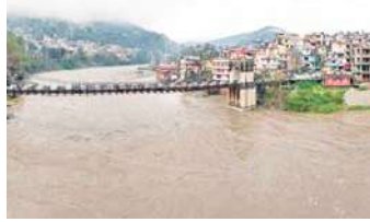
और उनके बेट रघु (25) साल की मौत हो गई। वहीं कठुआ के राजबाग इलाके में उड़न नदी में फंसे

नई दिल्ली। देश के अलग-अलग हिस्सों में बेमौसम बारिश की वजह से एक बार फिर टंड लौट आई है। कई जगहों पर जनवरी वाली टंड का अहसास हो रहा है। वहीं बारिश और ओलावृष्टि की वजह से फसलों को नुकसान हुआ है। जम्मू-कश्मीर में बारिश खी वजह से कम से कम 5 लोगों की जान चली गई। वहीं जम्मू-श्रीनगर हाइवे को भूखलन की वजह से बंद कर दिया गया है। जानकारी के मुताबिक कई जगहों पर हाइवे पर बड़े-बड़े पत्थर गिर गए हैं।