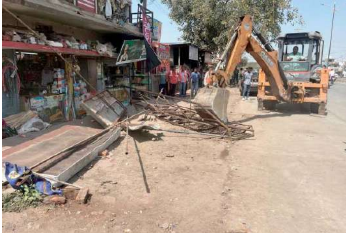
अंकेश बिरथरिया आदि उपस्थित थे। रिमूवल की टीम व यातायात बल द्वारा यातायात को सुचारू रूप से व्यवस्थित किया गया। उक्त कार्यवाही में 19 हजार रुपये की चालानी कार्यवाही की गई।

इंदौर। इंदौर में यातायात सुधार के लिए कलेक्टर श्री आशीष सिंह के निर्देशन में लगातार मुहिम चलाई जा रही है। मुहिम के तहत सड़कों और फुटपाथ पर सामग्री रख कर यातायात बाधित करने वालों के विरुद्ध कार्रवाई की जा रही है और अतिक्रमण हटाए जा रहे हैं। इसी सिलसिले में आज नगर निगम आयुक्त श्री शिवम वर्मा के निर्देश पर जिला प्रशासन, नगर निगम एवं पुलिस बल की संयुक्त टीम द्वारा झोन क्रमांक 13 में कार्रवाई की गई। बताया गया कि झोन क्रमांक 13 के अंतर्गत तेजाजी नगर चौराहे क्षेत्र में फुटपाथ पर अवैध रूप से बने 27 टिन शेड हटाए गये। अन्य अतिक्रमण भी हटाए गए। उक्त कार्यवाही में एसडीएम श्रीमती प्रियंका चौरसिया एवं जूनल अधिकारी