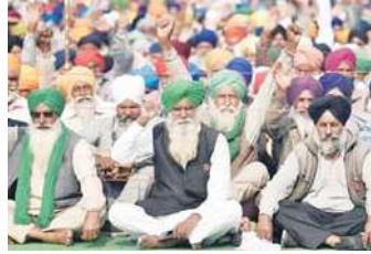
से तय मोर्चे पर जाने से पहले पुलिस ने किसान नेताओं के घरों पर छापा मारा. थाना पातड़ा के गांव मौलवीवाला

5 मार्च को चंडीगढ़ में लगने वाले मोर्चे के लिए मानसा पुलिस की ओर से बीती रात को किसानों के घरों में छापेमारी कर मानसा जिले के दर्जन के करीब किसानों को हिरासत में लिया गया है। किसानों के पहले