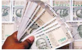
बैठक के दौरान मंत्रिमंडल ने केंद्र सरकार के कर्मचारियों के लिए महंगाई भत्ते (DA) में बढ़ोतरी पर चर्चा नहीं की

नई दिल्ली, (एजेंसी) सरकार केंद्रीय कर्मचारियों और पेंशनर्स के लिए जनवरी और जुलाई दो बार महंगाई भत्ते में इजाफा करता है. होली से पहले अगर महंगाई भत्ते में बढ़ोतरी होता है तो यह जनवरी से प्रभावी होगा. यह भी अक्सर देखा गया है कि मार्च में होली के आसपास महंगाई भत्ते और महंगाई राहत में इजाफा किया जाता है. ताकि त्योहार से पहले कर्मचारियों को राहत मिल सके. दूसरी ओर, जुलाई में बढ़ोतरी की घोषणा आमतौर पर हर साल अक्टूबर या नवंबर में दिवाली के आसपास की जाती है.