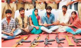
अमानवीय नीतियों से निराश हो चुके थे। उन्होंने यह भी आरोप लगाया कि वरिष्ठ नक्सली कैडर भोले-भाले