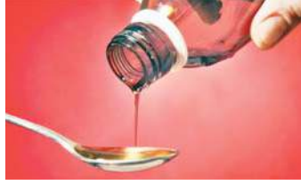
थी दवा 30 मिलीलीटर (ml) से बड़ी पैकिंग में आती है. अल्कोहल की मात्रा: जिसमें इथाइल अल्कोहल की

नई दिल्ली, (एजेंसी) देश में कफ सिरप और टॉनिक का नशे के रूप में हो रहे गलत इस्तेमाल को रोकने के लिए केंद्र सरकार ने एक बेहद सख्त कदम उठाया है. सरकार ने ड्रग्स रूल्स, 1945 में बड़ा संशोधन करते हुए ज्यादा अल्कोहल मात्रा वाली ओरल दवाओं (सिरप/टॉनिक) को 'शेड्यूल H1' श्रेणी में डाल दिया है. इस फैसले के बाद अब ऐसी दवाएं कार्डर पर खुलेआम बिना डॉक्टर के पर्चे (Prescription) के नहीं बेची जा सकेंगी. सरकार द्वारा जारी नए नियमों के मुताबिक, दो शर्तों को पूरा करने वाली सभी ओरल लिक्विड दवाएं अब कड़ी निगरानी के दायरे में होंगी- जो